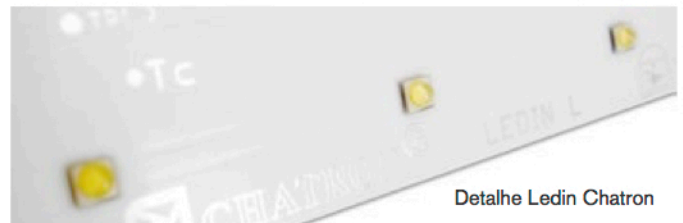
Detalhe Ledin Chatron

Consegue-se também, desta forma, um fluxo uniforme da luz ao longo de todo o difusor, com a beleza resultante dessa aplicação.