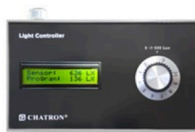
Consola Light Controller